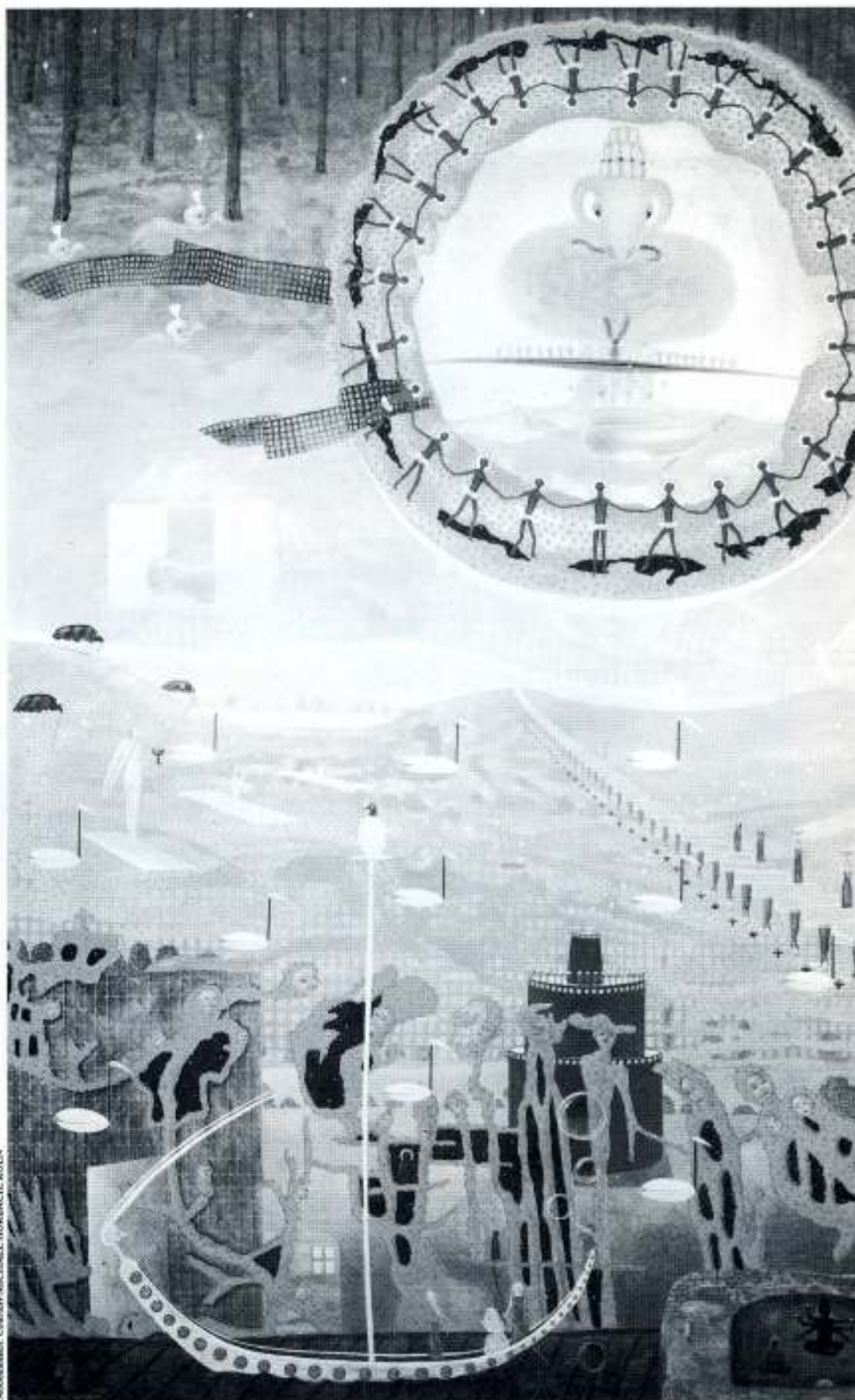
„Im Zeichen des Widder“, Acryl/Leinwand, 280 x 190 cm, 1987

In der Bresche, die er mit seinen reinigenden Beschmutzungen, seinen fäkalischen Fantasien, seinen Blut- und Scheiße-, Urin-Schweiß- und Sperma-Räuschen in die versteinerte Front der Institutionen, der Untastbarkeiten, des keimfreien, guten Geschmacks der Lügen und Absprachen, der aalglatten Abgefimtheiten reißt, können wir uns ein wenig aufrichten und den Staub von den Kleidern klopfen. Blalla spritzt gesundes Gift gegen die Giftimpfungen aus den Kanälen der sogenannten öffentlichen Meinung, des gesunden Volksempfindens und Menschenverstandes. Blalla wehrt sich dagegen, daß er zu Pergament, zur starren Menschengesamtheit wird, zu einem klinisch entkeimten Gast auf der „Fiesta der Sauberkeit“, wie es ein Werbetext neuerdings vom Bildschirm verkündet. Seine Gegenwelt soll uns aus dem Horror dieser Festlichkeiten erlösen.